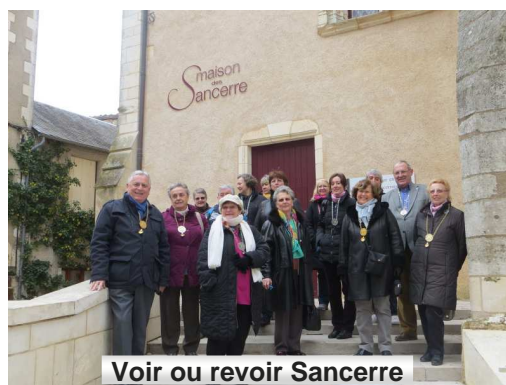
Voir ou revoir Sancerre

Voir ou revoir Sancerre est toujours un enchantement lorsque l'on regarde au loin la campagne environnante et les vignes qui coulent des jours heureux sur les coteaux, ➔