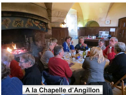
A la Chapelle d'Angillon

Nous nous contenterons de « Voyage au Centre de la France » et c'est déjà très beau !