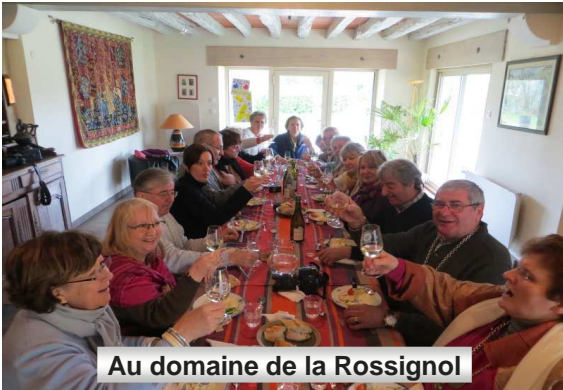
Au domaine de la Rossignol

Enfin, nous n'oublierons pas les vigneron du domaine de La Rossignol à Verdigny-en-Sancerre qui nous ont réservé un accueil chaleureux pour une dégustation de leurs vins et un repas du terroir simple et savoureux.